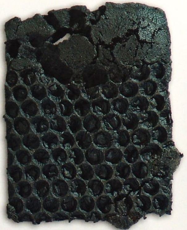
Struktur, 2007, 38 x 30 x 8 cm, schwarzes Steinzeug