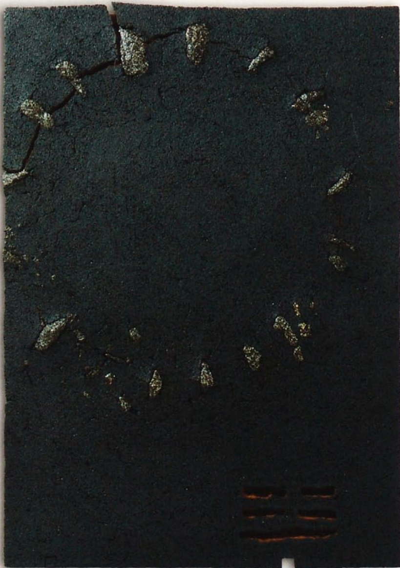
Kreis, 2008, 103 x 72 cm, braunes Steinzeug