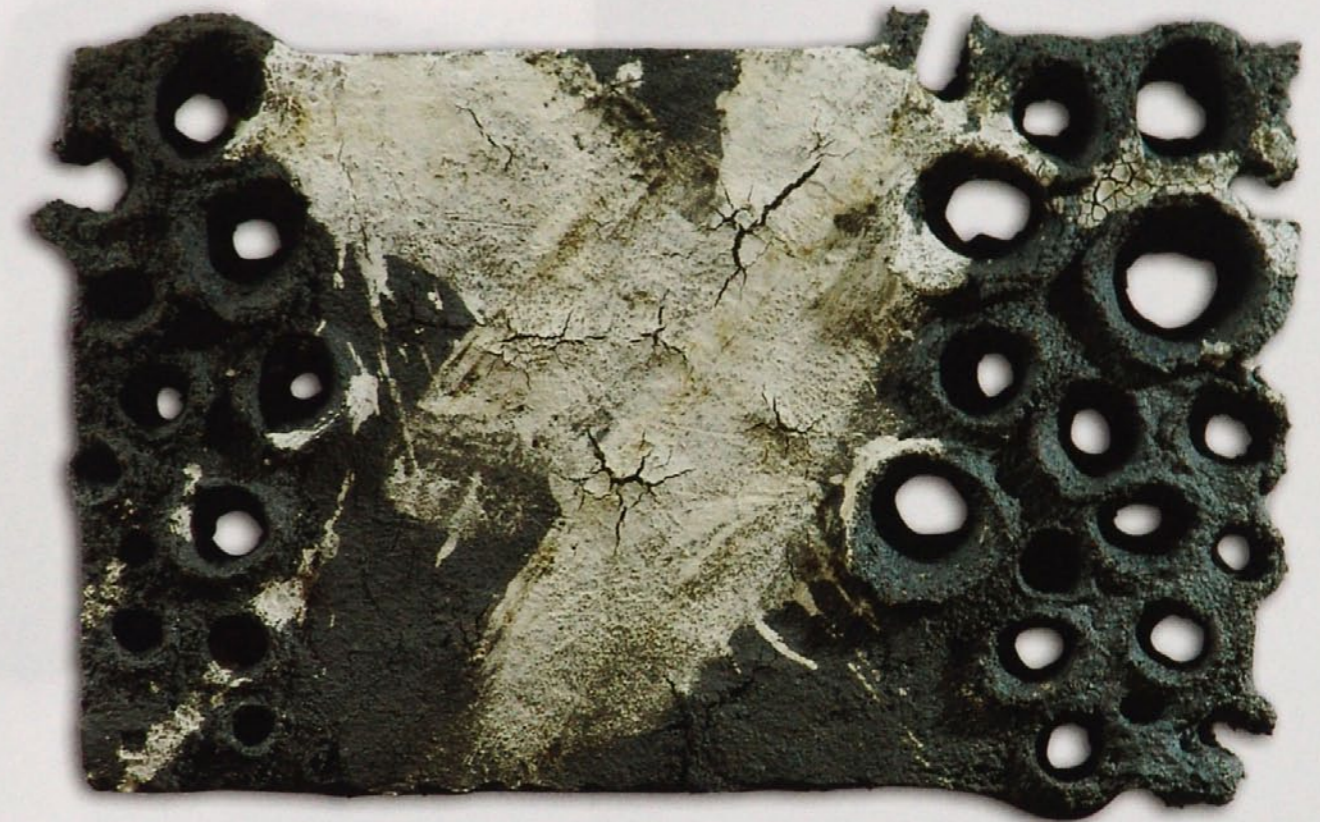
Aufbrüche, 2006, 58 x 37 cm, schwarzes Steinzeug