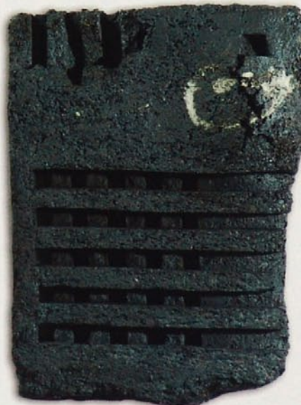
Pateras Keller, 2006, 42 x 31 x 8 cm, schwarzes Steinzeug