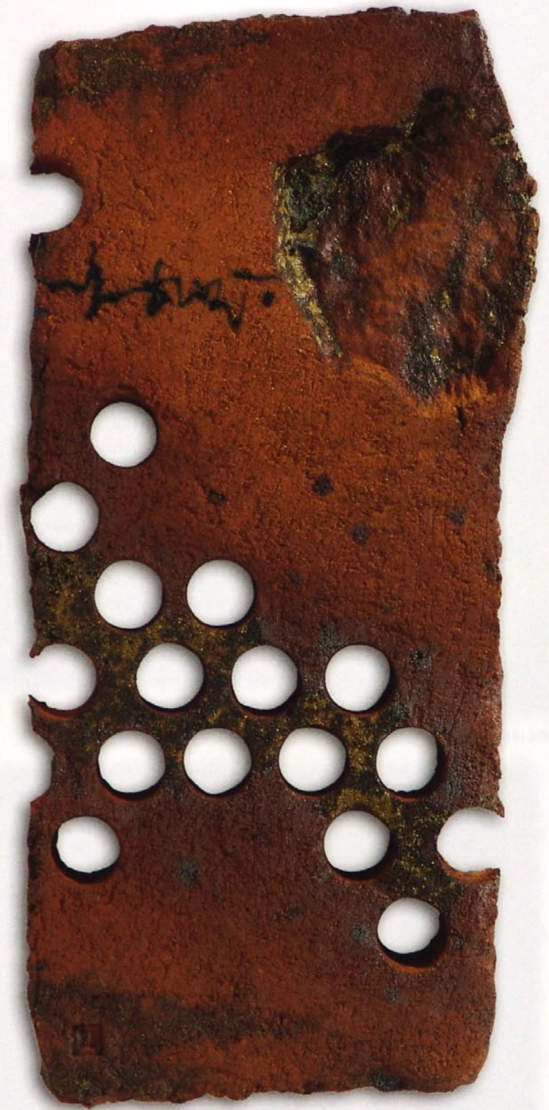
Tonraum, 2005, 70 x 34 cm, braunes Steinzeug